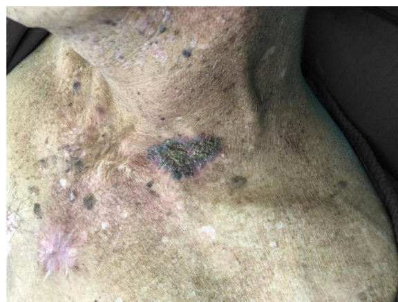
Figura 1 Placa descamativa em tórax anterossuperior.

Marina Zoéga Hayashida: Aprovação da versão final do manuscrito; concepção e planejamento do estudo;