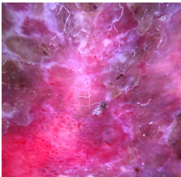
Figura 3 Dermatoscopia após remoção de crostas, demonstrando vasos glomerulares.