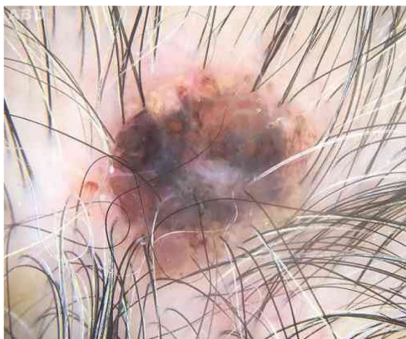
Figura 2 À dermatoscopia, observa-se crosta hemática e zona periférica eritematosa com glóbulos mal definidos.

desenvolveu lesão assintomática nodular e enegrecida com base eritematosa e crosta central no vértice do couro cabeludo (fig. 1). À dermatoscopia, observa-se área eritematoamarelada, glóbulos amarelados, crosta hemática, área vermelho-leitosa e vasos polimorfos, que sugere ceratose seborreica, tumor de anexo ou nevo melanocítico traumatizado (fig. 2). A presença de véu azul-esbranquiçado, área branca brilhante, aberturas foliculares assimétricas e estruturas romboidais não possibilitou exclusão da possibilidade de melanoma cutâneo (fig. 2). Foi feita biópsia excisional e o exame histopatológico evidenciou proliferação constituída por grandes massas de células basaloides e células sebáceas, dispostas de forma circunscrita, com a conclusão diagnóstica de sebaceoma.