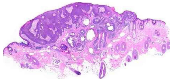
Figura 3 Sebaceoma. Neoplasia epitelial assimétrica disposta em "v", cujo vértice aponta para a profundidade. Há área de acantose à esquerda e predomínio de massas dérmicas à direita, que conferem assimetria intrínseca ao conjunto, característica pouco usual para esse tipo de proliferação. As massas têm formas e tamanhos regulares, predominantemente arredondadas ou ovais, e estão imersas em estroma colagenizado. Nesse aumento panorâmico já são percebidos grupamentos de células epiteliais de citoplasma pálido que permeiam as massas, representativas de sebócitos maduros (hematoxilina & eosina, 20×).

O sebaceoma já foi chamado de sebomatrixoma ou epitelioma sebáceo, e o termo epitelioma sugere malignidade. Classificado por Troy e Ackerman em 1984 como neoplasia benigna com diferenciação sebácea, acomete mais