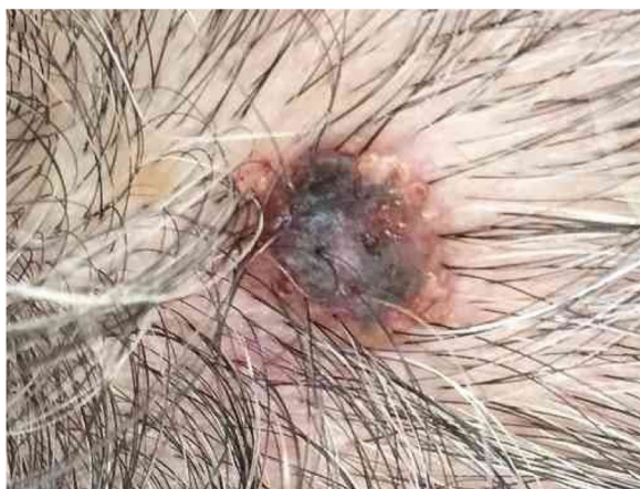
Figura 1 Nódulo enegrecido com base eritematosa e crosta central no vértice do couro cabeludo.