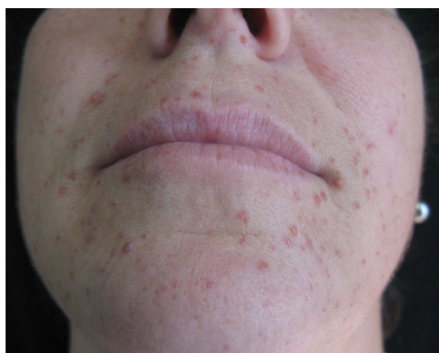
Figura 1 Xantogranulomas múltiplos. Detalhe de pápulas de coloração amarelo-acastanhada, de consistência firme, de 1-3 mm de diâmetro, dispersas na face.