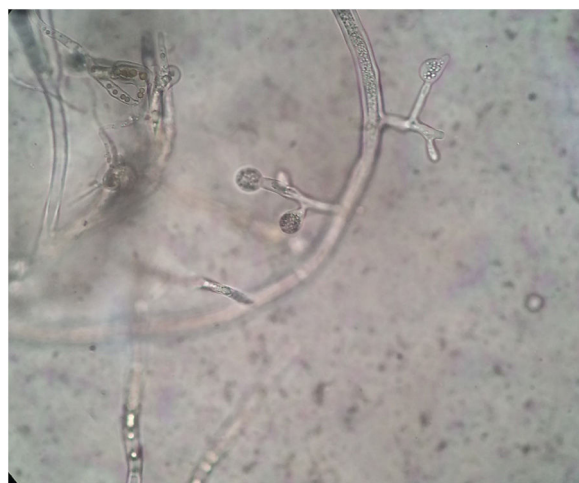
Figura 3 A microscopia de material da cultura revelou esporângios esféricos, hifas longas e hialinas e rizoides sem estolões distintos (400 ×).

acordo com um teste de suscetibilidade a medicamentos. O tratamento com AnB foi iniciado com uma dose diária de 1 mg, progrediu gradualmente para uma dose diária máxima de 40 mg. Após uma semana, a úlcera superficial tornou-se mais seca, com a formação de novo tecido de granulação; a crosta necrótica despreendeu-se e as secreções purulentas desapareceram. No entanto, os efeitos colaterais apareceram gradualmente: febre alta, coriza, dor muscular, dor de cabeça e vômitos, bem como hipocalcemia e hipoproteinemia graves. A função renal começou a deteriorar-se levemente. Assim, a AnB foi substituída por AnB lipossomal, que foi mais eficaz e apresenta menos efeitos colaterais no tratamento de infecções fúngicas invasivas. 1 Com o alívio dos efeitos colaterais, a lesão se resolveu gradualmente. A pesquisa de fungos na lesão cutânea foi negativa (fig. 4). Quando a dose total atingiu 1,5 g, o tratamento com AnB foi interrompido e substituído por itraconazol oral (400 mg por dia) por dois meses. Não foi observada recorrência durante os três