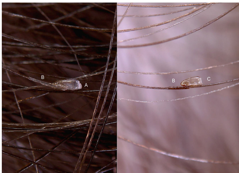
Figura 1 Entodermoscopia da lêndeia de Phthirus capitis no couro cabeludo sem interface líquida (30 × ). (A) Opérculo em forma de cúpula; (B) manguito de fixação longo e tubular; (C) lêndeia sem opérculo.