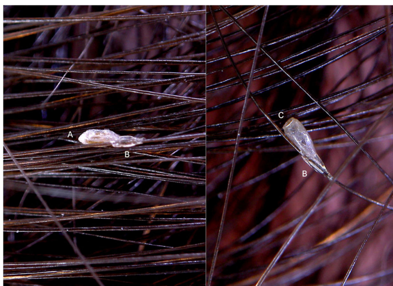
Figura 2 Entodermoscopia da lêndeia do Phthirus pubis no couro cabeludo sem interface líquida (30 × ). (A) Opérculo em forma cônica; (B) manguito curto e grosso na haste do cabelo; (C) lêndeia sem opérculo.

crita como Phthirus capitis ou pubis , como já proposto por alguns autores. 1,2 Por fim, embora seja uma mera opinião do autor, este comportamento original do agente da pediculose pode tornar-se assunto de especulação para entomologistas e dermatologistas pela possibilidade de que um patógeno humano obrigatório ter sido forçado a mudar devido a uma pressão evolutiva dos hábitos e costumes da sociedade, além de possivelmente também pelo impacto das mudanças climáticas. Assim, a entodermoscopia apresenta-se como uma ferramenta adequada para o diagnóstico de uma ectoparasitose, mesmo quando em locais inesperados do corpo.