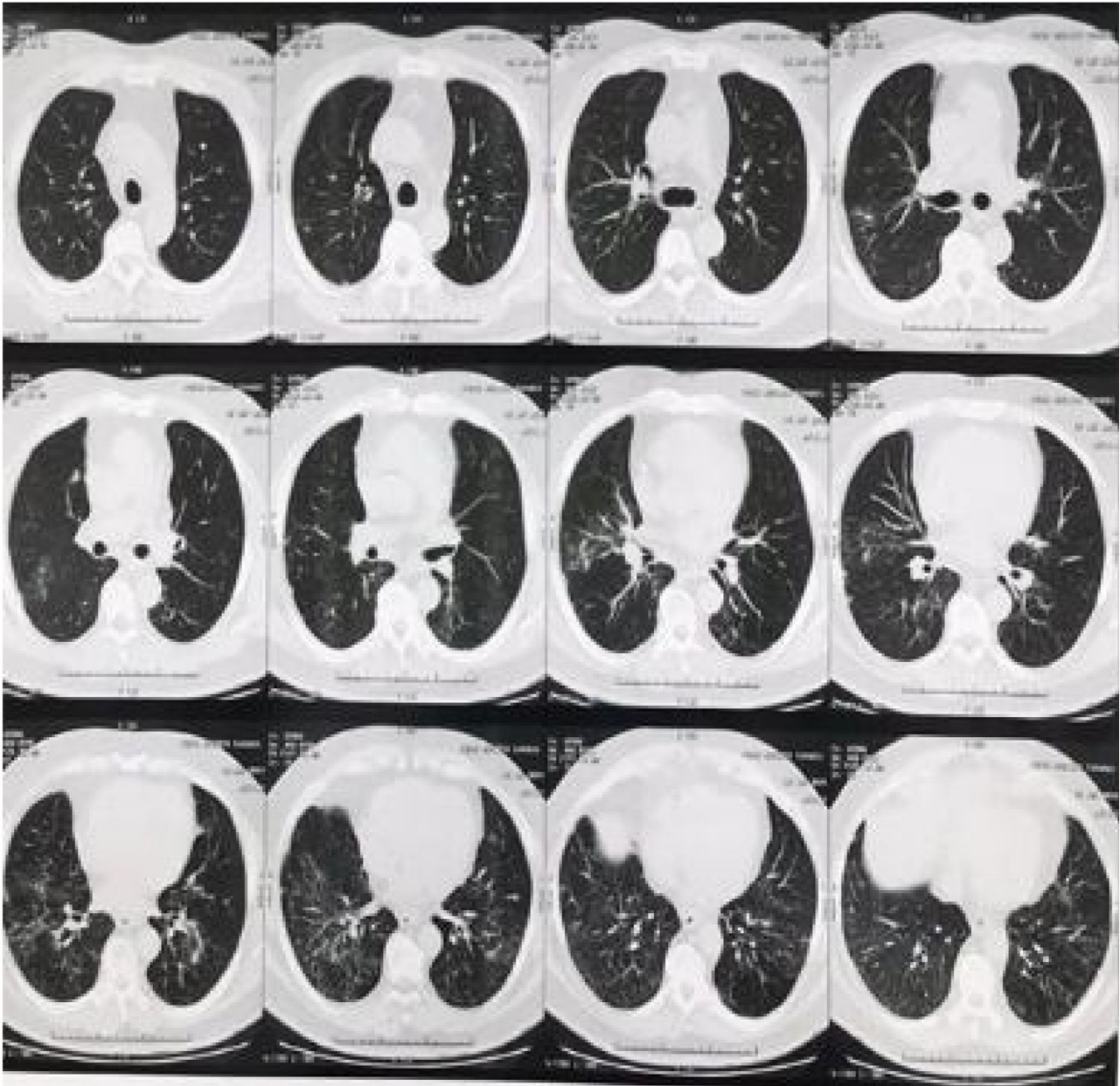
Figura 1 Infiltrado pulmonar bilateral, caracterizado por opacidades em vidro fosco e reticulação fina de predomínio basal. Opacidades nodulares e em vidro fosco com distribuição centrolobular esparsa, mais evidente no lobo médio.

O adalimumabe foi suspenso em decorrência da hipótese de tuberculose pulmonar ou pneumopatia intersticial induzida pelo medicamento. O paciente negava contato com sintomáticos respiratórios. Foi realizada broncoscopia com lavado brônquico e cultura, bacterioscopia, fungoscopia e BAAR, todos negativos. Foi descartada, então, a hipótese de etiologia infecciosa e solicitada nova TC do tórax (fig. 2), três meses após a suspensão da medicação, cujo laudo evidenciou opacidades retículo-nodulares esparsas no parênquima pulmonar bilateralmente, mais evidente