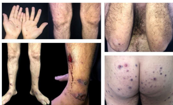
Figura 1 Lesões purpúricas nas mãos, lesões papulopustulosas, purpúricas e ulceronecroticas nos membros inferiores e lesões ulceronecroticas na região glútea e cotovelo.