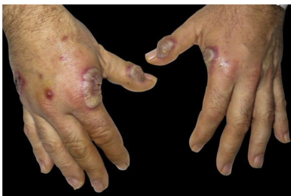
Figura 1 Apresentação clínica. Placas eritemato-violáceas, pústulas e lesões bolhosas no dorso das mãos.

lesões cutâneas na região dorsal das mãos, associadas a dor torácica, tosse e expectoração leves, que apareceram simultaneamente. O paciente não apresentava febre ou outros sintomas agudos. Ele não havia começado a tomar nenhum medicamento novo, mas reconheceu o uso frequente de cocaína por oito meses.