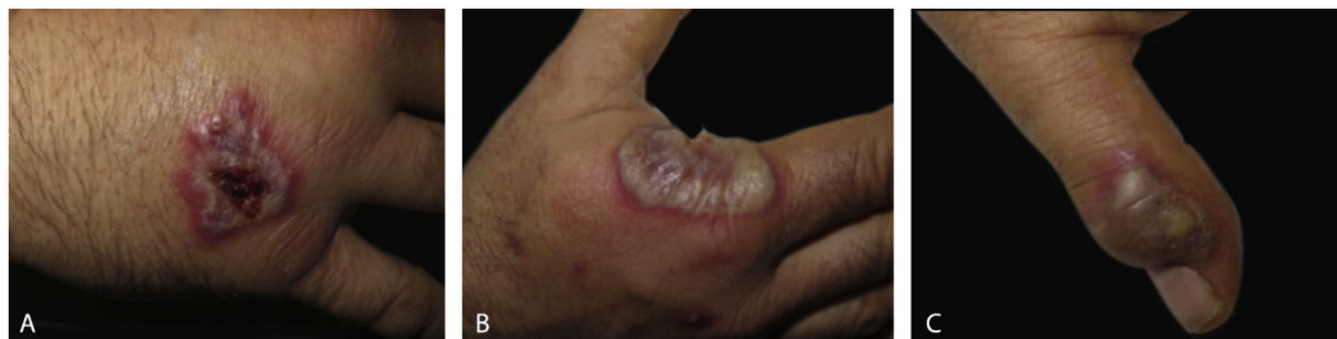
Figura 2 Detalhe de lesões individuais de dermatose neutrofílica do dorso das mãos. (A), Placa violácea crostosa; (B), grande bolha com base eritematosa na região radial da mão direita; (C), lesão com exsudato purulento sobre a articulação interfalangeana da mão esquerda.

A DNDM é atualmente considerada uma variante localizada incomum da SS. 4 Clinicamente, a DNDM é caracterizada por placas e nódulos eritemato-violáceos, frequentemente ulcerados, afetando predominantemente o dorso das mãos. 4 Esse