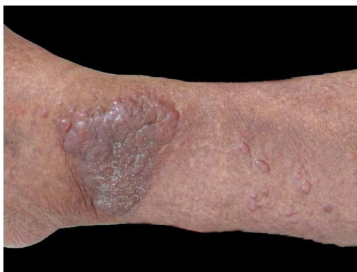
Figura 1 Pápulas de aspecto queloidiformes, eritematosas e grande tumoração no tornozelo.

evidenciar seu polimorfismo e destacar a relevância do diagnóstico e tratamento precoces.