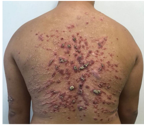
Figura 3 Predomínio de lesões cicatriciais após o tratamento com anfotericina B lipossomal, porém ainda mantendo algumas lesões ativas (dose total acumulada 3 g).

Após dois meses do segundo tratamento, o paciente evoluiu com recidiva parcial. Na tentativa de evitar outra internação prolongada com múltiplas morbidades, optou-se pelo tratamento com miltefosina 50 mg de 8/8 horas por 38