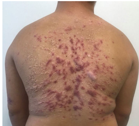
Figura 4 Resposta satisfatória imediatamente após o tratamento com miltefosina.

dias, com boa resposta e tolerabilidade (fig. 4). O paciente manteve boa resposta no acompanhamento três meses após a medicação, permanecendo apenas com lesões cicatriciais (fig. 5).