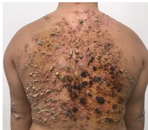
Figura 1 Pápulas coalescentes formando extensa placa verrucosa no dorso, observada na primeira consulta.

Paciente do sexo masculino, 28 anos, portador de síndrome de Down, com relato de aparecimento de lesões no dorso havia um ano e três meses, com aumento progressivo (fig. 1). Não havia prurido, dor ou sintomas sistêmicos associados. O paciente referiu tratamento prévio com itraconazol e ter-