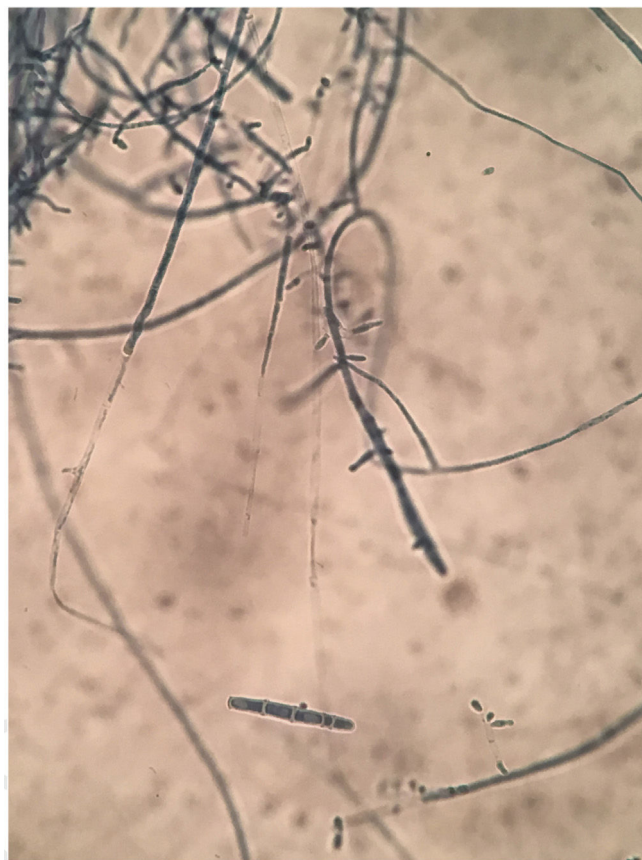
Figura 3 Exame microscópico mostrando esporos macroconídeos e microconídeos semelhantes a clavos.