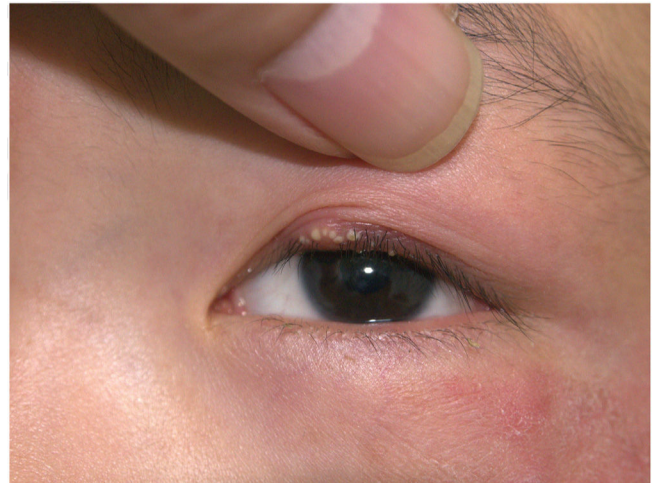
Figura 1 Apresentação clínica: eritema com descamação discreta na pele periorcular e papulopústulas leitosas do tamanho de sementes de gergelim na pálpebra superior esquerda.

A dermatofitose é infecção fúngica superficial comum, geralmente causada por Trichophyton rubrum . Pés, tronco e unhas são os locais mais afetados. As características de uma lesão típica consistem em uma clareira central, cercada por borda elevada progressiva, eritematosa, descamativa e com vesículas, que também podem aparecer na borda da área afetada com o aumento da inflamação. 1 A blefarite é doença inflamatória crônica das pálpebras, com sintomas complexos, geralmente causada por colonização bacteriana e ácaros Demodex . 2 No entanto, alguns dos