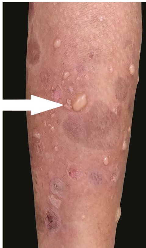
Figura 2 Imagem clínica de lesão tipo penfigoide bolhoso sobre pele normal e inflamada (seta).

mas a microscopia imunoeletrônica revela que esses depósitos estão localizados na base das bolhas, e não no teto, como no LP bolhoso.