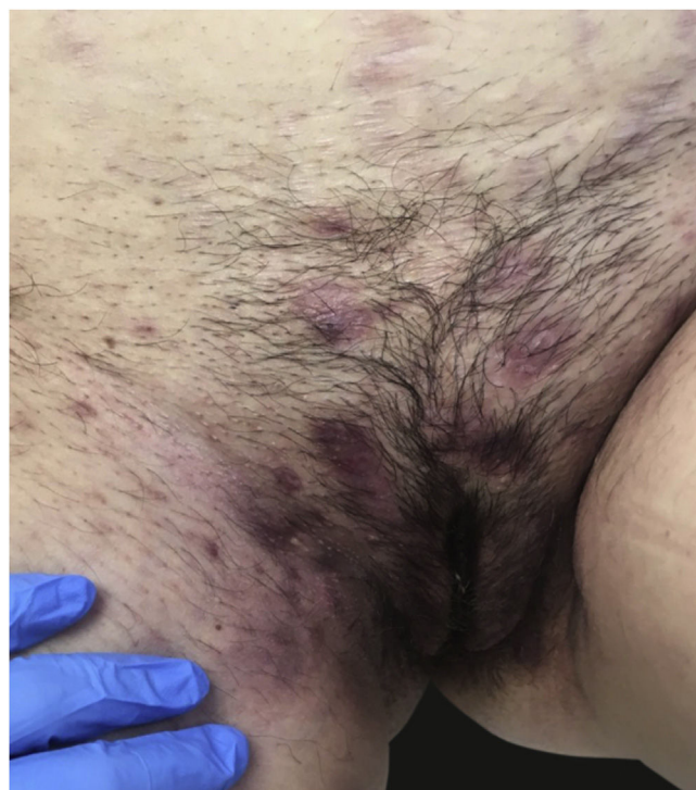
Figura 8 Hidradenite supurativa.