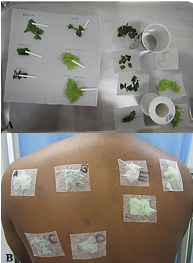
Figura 2 (A) Preparo das folhas com água bidestilada para realização do prick by prick à esquerda e do teste de contato à direita. (B) Aplicação das folhas para o teste de contato identificadas por letras, sendo: (A) coentro; (B) cebolinha; (C) salsa; (D) agrião; (E) caule de alface americana; (F) folha de alface americana; (G) folha e caule de alface crespa.

ocorrer reações cruzadas com outras plantas da família Compositae , como chicória, alcachofra, camomila, girassóis, até produtos de higiene e dermocosméticos que contêm SLs na formulação. 2,5,6