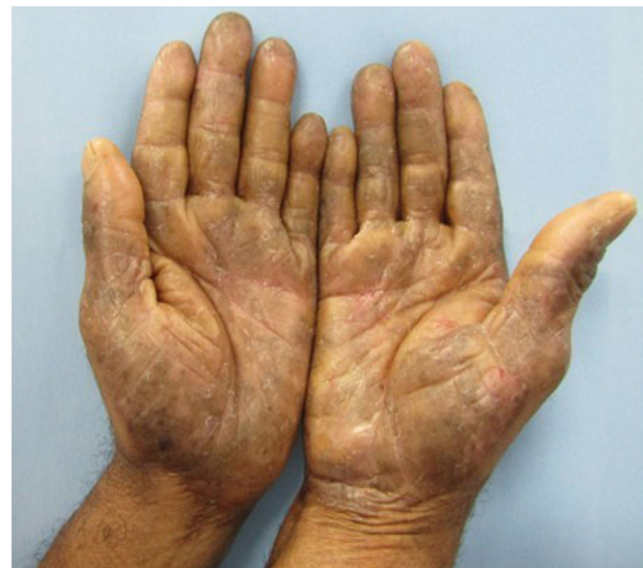
Figura 1 Ao exame, observam-se placas eritematosas, acastanhadas, com liquenificação, descamação, erosões e fissuras nas mãos.

A bateria latino-americana para testes de contato conta com 40 substâncias, incluindo as SLs, que são metabólitos de plantas da família Compositae capazes de induzir citotoxicidade cutânea, causando dermatites graves. 3 Sua sensibilidade é testada usando uma mistura de três compostos em concentrações equimolares: alantolactona (classe eudesmanolida), costunolide (classe germacranolida) e dehidrocostus lactona (classe guaianolida), com concentração de 0,1% em petróleo; 4,5 raramente causa reações falso-positivas, pois há baixo risco de sensibilização ativa. Podem