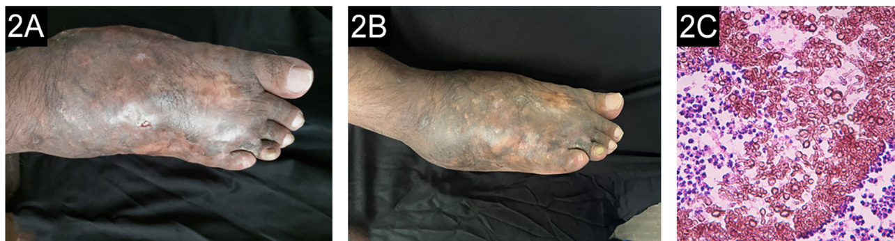
Figura 2 (A) Paciente 5: micetoma causado por Madurella pseudomycetomatis , antes de iniciar o tratamento. (B) Ao final do tratamento. (C) Grânulo composto por hifas grossas e marrons (Hematoxilina & eosina, 10×).