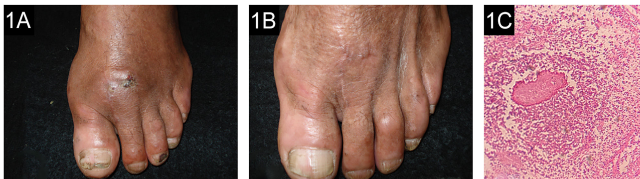
Figura 1 (A) Paciente 1: micetoma por Fusarium chlamydosporum , antes do tratamento. (B) Ao final do tratamento de 18 meses. (C) Microabscesso com grânulo na histopatologia (Hematoxilina & eosina, 10×).